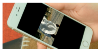
スマホ画面で動画