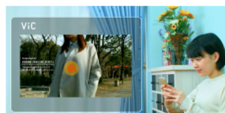
画面タップで詳細表示