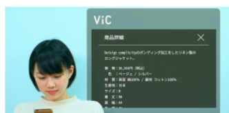
テキストで詳しく