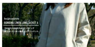
アニメーション文字を表示